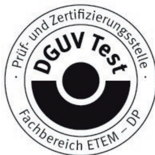
Signature (Dipl.-Ing. Vogl)

Further provisions concerning the validity, the extension of the validity and other conditions are laid down in the Rules of Procedure for Testing and Certification of August 2012.